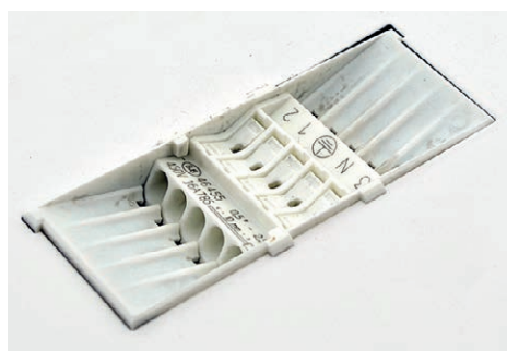
BALEO-LED NB-OP-4K, IP40/44